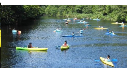
ねえ、ねえって・・・ 何話しているんだろうね