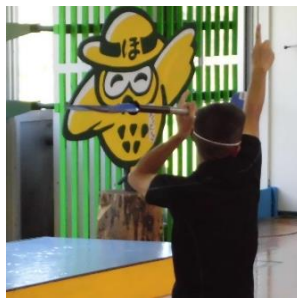
乗り方を習って・・・