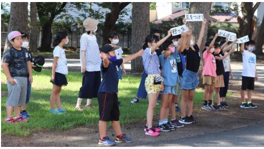
行ってらっしゃい