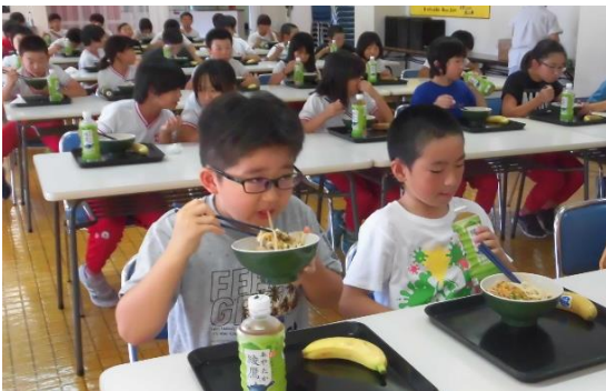
そして腹ごしらえ