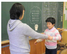
書き二 表初 彰年 め生 で展 すの ね