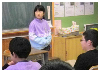
思のい 様五 出年 子生 でピ すー すね チ