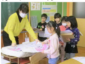
提冬 出休一 しみ年 での生 い宿 ま題 すを

さて、新しい年、令和2年のお正月はどのように過ごされたでしょうか。また、風邪などの病気はありませんでしたか。今日から後期後半が始まり、一人の欠席者もなくスタートしました。張り切って登校してきたお子さん、ちょっと眠そうで、うつむき加減で歩いてきたお子さん。学校の始まりは「ひきこもごも」ですが、卒業、修了の日まで、およそ40数日。まとめや復習をしっかりと行いながら、力をつけていきたいと思います。引き続き、ご支援をよろしくお願いいたします。