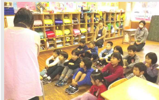
<お話に聞き入る2年生>

同じく昨日、「いろりの会」の皆さんによる読み聞かせがありました。月に一度の機会ですが、子どもたちがとても楽しみにしている日でもあります。読み聞かせの後には、感想発表が行われ、学年に応じた、子どもたちの素直な気持ちを伝えることができました。