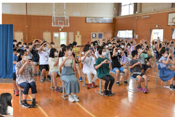
担当の先生から夏休み中のくらしやプール利用について大切なお話がありました