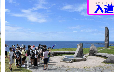
空と海のコントラストが見事です!