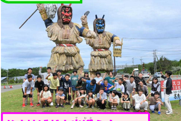
なまはげがお出迎え! 男鹿水族館GAO!