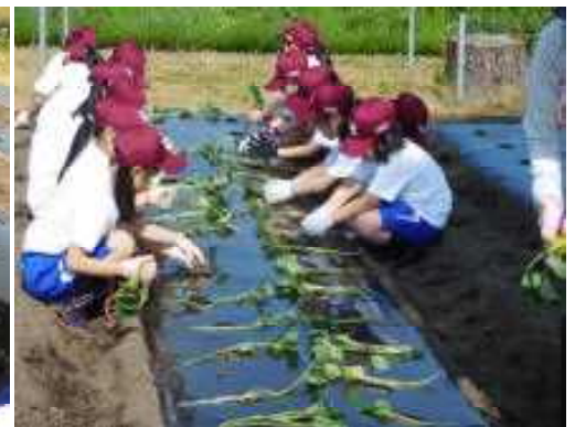
こちらもサツマイモです