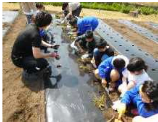
サツマイモ なかなか難しい