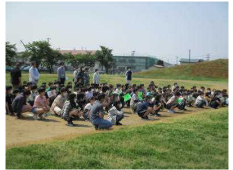
野球場へ避難完了