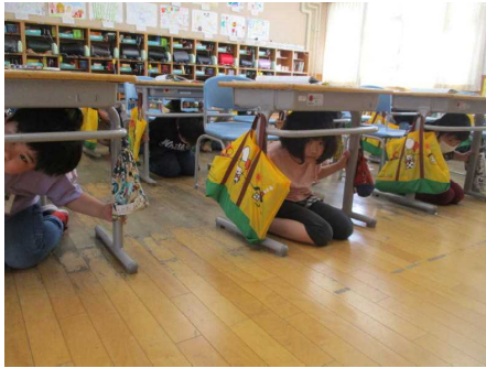
机の下へ頭をかきします

避難するときに大切な「お・は・し・も」についても確認しています。「㊦さない・㊧しらない・㊨ゃべらない・㊩どらない」です。子どもたちは、本番を想定して落ち着いて避難することができました。