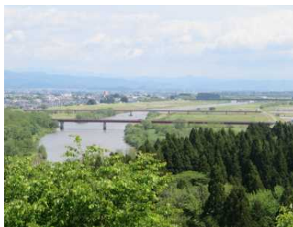
姫神公園から大曲方面の景色