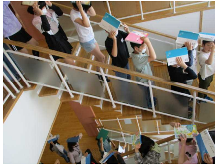
頭を守りながら避難