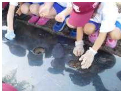
枝豆は2粒ずつ植えました