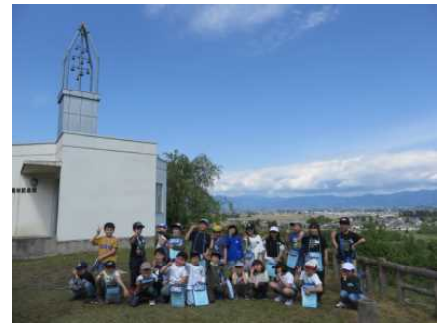
最後はみんなで記念撮影