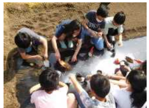
ジャガイモを植えています