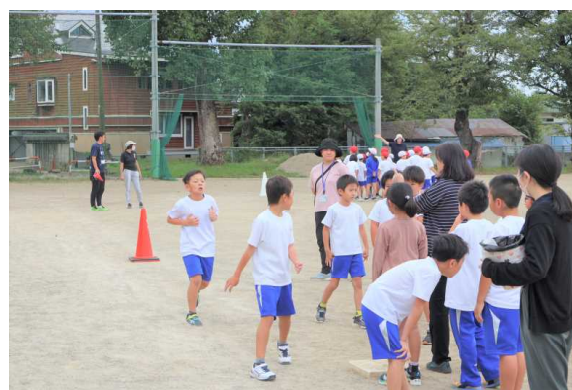
パワーアップタイム（令和5年9月26日）

※9月3日(日)の「早朝窓ふき・グラウンド側溝掃除奉仕作業」の参加者用に、PTAの保体部で事前にお茶を用意していましたが、中止となったため、10月3日(火)に子どもたちに一人1本ずつ配付し、持ち帰るようにしますのでご承知おきください。