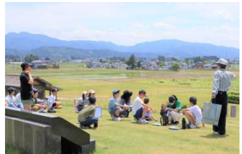
(6年 払田の柵) ボランティアの方が熱心に説明してくれました。