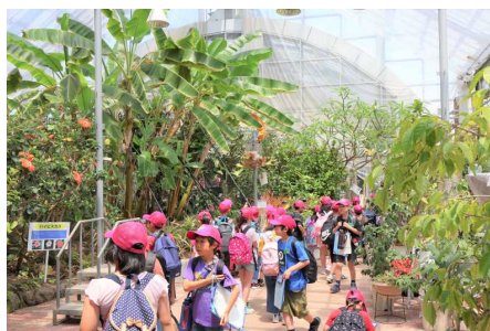
(2年 農業科学館 熱帯温室)