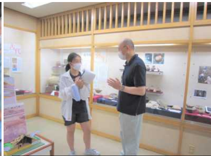
(6年 埋文) 学芸員の先生が質問に答えてくれました。