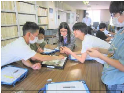
(6年 埋文) 本物の「石器」を触りながら、どのように使ったのか学びました。