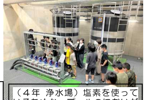
(4年 浄水場) 塩素を使っているためか、プールのにおいがしました。