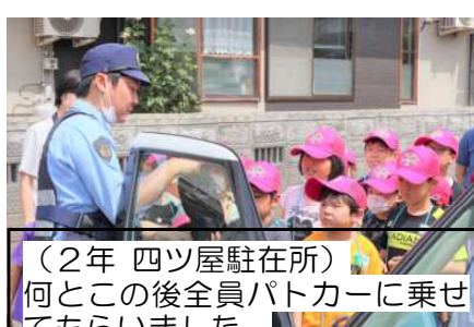
(2年 四ツ屋駐在所) 何とこの後全員パトカーに乗せてもらいました。