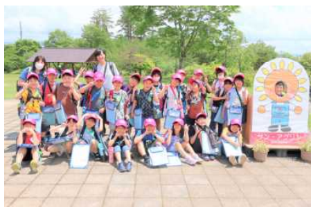
(2年 農業科学館で記念撮影)