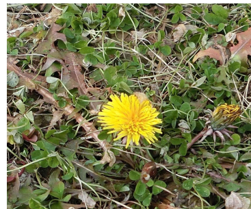
学校の玄関前で、タンポポの花を見つけました!(1/27)