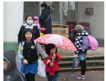
こども園での引き渡しの様子