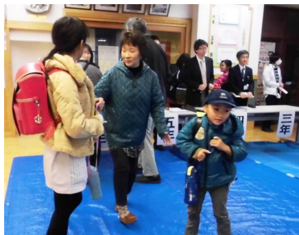
校内での引き渡しの様子

今回は、四ツ屋こども園、れみ保育園と連携しての引き渡し訓練でしたが、各ご家庭の協力のおかげでスムーズに引き渡しを行うことができました。今回確認した校地への車の進入経路や園児がいるご家庭の駐車場所などを、今後の非常時の対応に生かしていきたいと思っております。