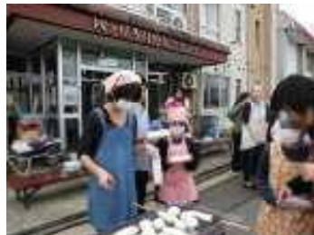
きりたんぽ・みそ焼きおにぎり