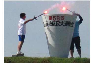
昨年の聖火台への点火

日程や参加の約束については、前号（No.20）を今一度ご確認ください。ご家庭や地区での、見守り等のご協力をお願いいたします。