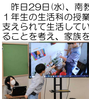
動画を使って、自分の頑張りを友達に紹介しました。

昨日29日(水)、南教育事務所〇〇出張所の〇〇〇〇指導主事をお迎えして、1年生の生活科の授業を参観していただきました。これまでの学習で、家族に支えられて生活していることに気付いた子どもたちは、家庭の中で自分でできることを考え、家族を笑顔にするための作戦を計画し実践しました。今回の授業では、個々に実践した様子をお互いに紹介し合う活動を行い、自分でできることが増えた喜びや家族を笑顔にするために、これからも続けていこうという意欲を高めることができました。