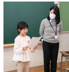
自分で頑張ったことを自信をもって発表しました。

今回の授業に向けて、1年生の保護者の皆様には、お家での子どもの頑張っている様子を動画で撮影してくださったり、子どもたちへの温かい励ましのコメントをいただいたりと、たくさんのご協力に心から感謝申し上げます。