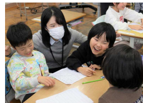
グループでの話し合いを通して、友達からたくさん学びました。