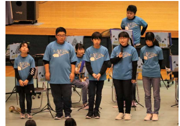
歯切れよく堂々と内小器楽部を紹介する6年生部員

今回の演奏会のために、器楽部員の保護者の皆様方には、楽器の搬出入等でたくさんのご支援とご協力をいただきました。本当にありがとうございました。