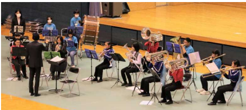
大仙市出身の作曲家・〇〇〇氏によるクリニックで、大曲仙北スーパーキッズが演奏した「もみじ」(文部省唱歌)も見事な演奏でした。

先週18日(土)、美郷町総合体育館リリオスを会場に開催された「第31回大曲仙北小学校交流演奏会」に、本校の器楽部が参加し、会場に集まった大曲仙北地区の器楽部の子どもたちや多くの観客を前にして、大変素晴らしい演奏を披露しました。