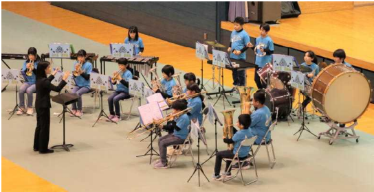
観客の心を一つにする見事な演奏を披露!