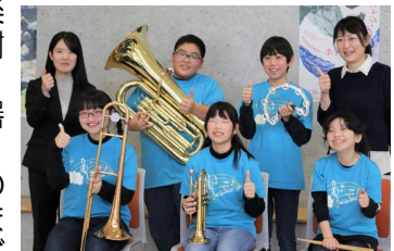
6年生部員と主担当の〇〇先生、学級担任の〇〇先生