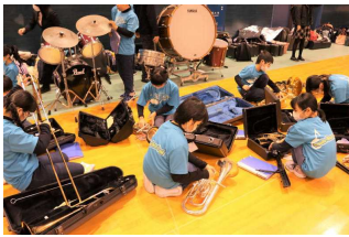
演奏前の楽器の準備