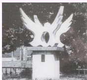
はばたきの像（昭和62年12月17日）