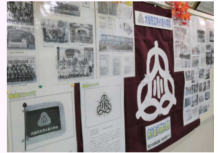
児童玄関の掲示板に「内小友小学校の歴史」コーナーとして過去の写真を掲示しました。

これまで、野球やミニバスケットボールのスポ少の大会や、器楽部のコンクール等で輝かしい成績を残すなど、その名を全県下にとどろかせてきました。来年はいよいよ創立150周年となり、盛大に記念式典が挙行される予定です。