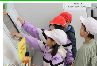
自分で切符を買って、電車に乗りました。

子どもたちは、引率の先生方からのお話をしっかりと聞くとともに、ルールを守って友だちと仲良く活動することができました。特に、2年生の子どもたちは、グループのリーダーとして1年生の面倒を見ながら、張り切って頑張ろうとする姿が随所に見られました。当日はみんな笑顔いっぱい、楽しく充実した一日を過ごすことができました。