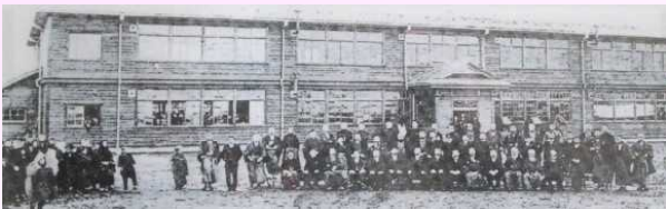
大正元年11月20日 開校式学校風景