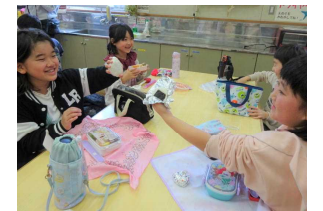
遊んだ後は昼食タイム！