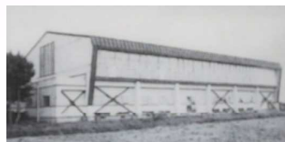
体育館（昭和55年12月25日落成）