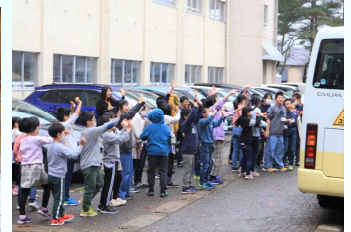
支援学校のお友達が帰る際に、みんなでお見送りをしました。