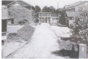
昭和46年度の内小友小学校