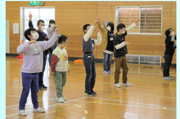
「よろしくねの会」で「つばめダンス」を一緒に踊りました。

子どもたちの自然な気遣いや笑顔が随所に見られ、終始心温まる活動に毎回感動しています。相手の立場で物事を考えたり多様性を受け入れたりする姿勢を身に付ける経験として、これまで長く積み重ねられてきた「ハローの会」は、本校にとって本校の子どもたちの穏やかな雰囲気は、長年続け