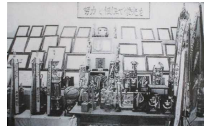
多くの優勝旗や優勝トロフィー