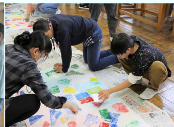
3年（絵本の読み聞かせ）