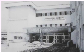
堂々の新校舎（昭和49年10月29日落成）