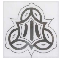
校章（昭和38年3月20日制定）