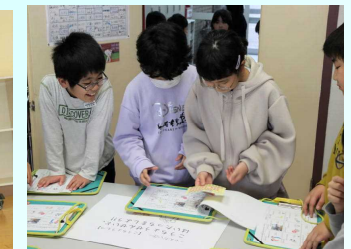
4年（内小ウォークラリー）

子どもたちの自然な気遣いや笑顔が随所に見られ、終始心温まる活動に毎回感動しています。相手の立場で物事を考えたり多様性を受け入れたりする姿勢を身に付ける経験として、これまで長く積み重ねられてきた「ハローの会」は、本校にとって本校の子どもたちの穏やかな雰囲気は、長年続け