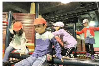
みんなで仲良く遊びました。