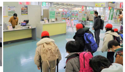
あいさつもしっかりできました。