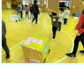
2年（巨大パタパタカー）

や特色ある教育活動の一つになっており、られてきたこの交流によって育まれているのではないかと感じています。