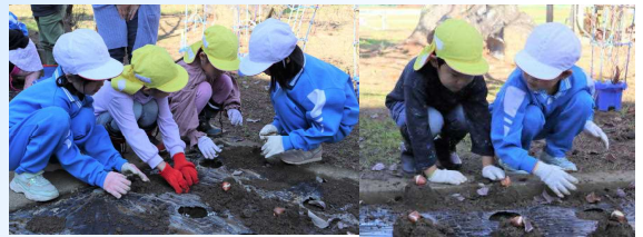
1・2年生が、年長さんに植え方を優しく教えていました。

また、この日の昼休みの時間を利用して、3・4年生の子どもたちがプランターへの球根植えをしてくれました。