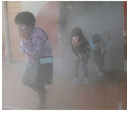
煙の中は身を低くして避難!

昨日1日(水)、大曲消防署のご協力の下、火災を想定した避難訓練と煙道体験を行いました。子どもたちは、避難時の約束である「お・は・し・も」(◎：押さない・㊦：走らない・㊩：しゃべらない・㊪：戻らない)をしっかりと守って素早く整然と避難でき、消防署の方からお褒めの言葉をいただきました。