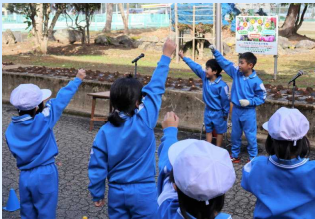
2年生の音頭で「がんばろうコール」をしてスタート！

今週火曜日の3校時に、1・2年生が内小友保育園の年長さんと一緒に、児童玄関前の花壇にチューリップの球根を植えました。今回植えた球根は、公益財団法人コメリ緑育成財団よりいただいたもので、植え付け作業の際にはコメリの職員の方が来校し、植え付けの仕方を教えてくださいました。