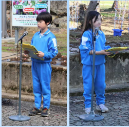
2年生が会の進行をがんばってくれました。