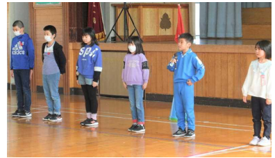
各学年の代表者が避難訓練後の感想をしっかりと発表しました。