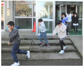
整然と避難する子どもたち