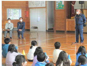
消防署の方から避難時のポイントを教えていただきました。