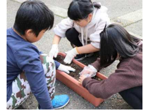
プランターへの球根植えは3・4年生が担当しました。

チューリップに限らず、多くの秋植え球根類は、冬の低温に一定期間遭遇することで、茎を伸ばす性質があります。今回植えた球根も、冬の寒さを経験し、暖かい春になれば茎を伸ばし、きっときれいな花を咲かせることでしょう。今からとても楽しみです。