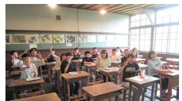
思い出の潟分校の見学