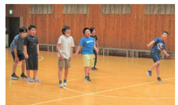
みんなでドッジボール