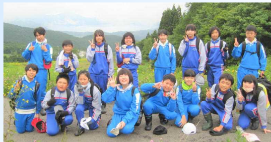
大川西根小の5年生と一緒に記念撮影