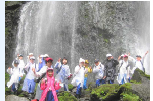
友情の滝へのウォーキング

あっという間の2日間で、とても充実した体験学習になりました。事前交流も含めた今回の体験学習で、大川西根小の友達と仲良くなれたとともに、いつも一緒に過ごしている友達のよさも改めて見つけれられたのではないかと思います。この自然体験学習をきっかけに、友情をさらに深めてくれればと思います。