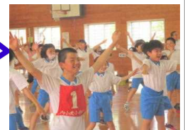
全員でラジオ体操

「新体カテスト」とは、スポーツ庁が「児童生徒の体力・運動能力の現状を把握し、体力の向上の成果や課題を捉えることで、学校体育に係る指導法の改善等を図ること」を目的に、毎年実施しているものです。