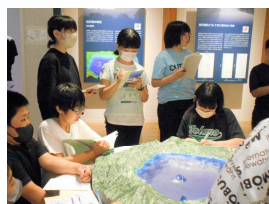
クニマス未来館の見学