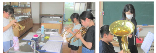
〇〇先生の指導のもと、めきめき上達しています。