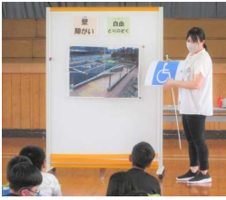
バリアフリーの説明

先週21日(水)、大仙市社会福祉協議会や地区民生委員の皆さんにご来校いただき、4年生を対象に「菜のはなタイム」を実施しました。「菜のはなタイム」は、バリアフリー体験活動を通してハンディキャップがある生活について考え、バリアフリー社会に対する意識を一層高めることをねらいとしています。