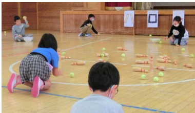
4年生 (ピン倒しボール)