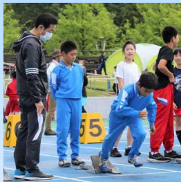
スタートダッシュ練習でグラウンドの感触を確認

この大会には、本校から〇〇〇〇さん(4年)と〇〇〇〇さん(4年)が出場しました。当日は時より小雨の降る中での競技となりましたが、自分のもてる力をしっかりと発揮することができました。