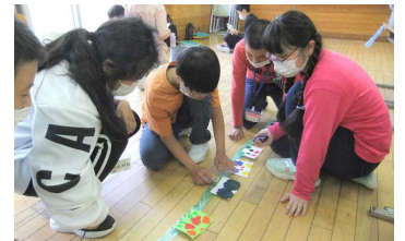
6年生 (コラージュ作品制作)