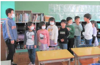
← 登校班の並び方を確認しました。