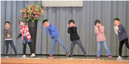
新入生に歌を披露してくれた2年生

1年生の皆さんに、みんなと仲良くする上で大切な「あいさつ」のお話をし、1年生全員が手を挙げて頑張る約束をしてくれました。