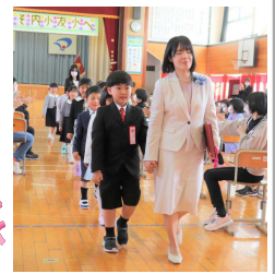
大きな拍手で見送られる新入生