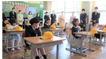
教室で担任の先生のお話を聞く新入生