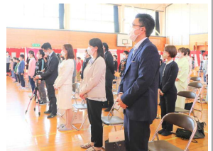
保護者の方々が見守る中、入学式を挙げてきました。