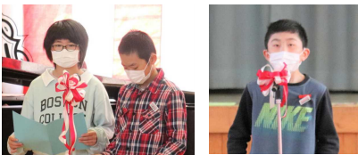
「ようこそ1年生の会」で司会や歓迎のあいさつを頑張った6年生

内小友小学校の1年間の様子をまとめたスライドを上映しながら、2～6年生全員で「チャレンジ」という歌をプレゼントし、1年生を温かく迎えてくれました。1年生の皆さんには、これから始まる内小友小学校での生活を、元気いっぱい、笑顔いっぱい送ってくれることを願っています。