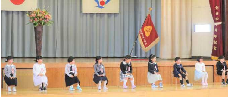
新入生9名全員がそろって入学式を迎えることができました。

1年生の皆さんに、みんなと仲良くする上で大切な「あいさつ」のお話をし、1年生全員が手を挙げて頑張る約束をしてくれました。