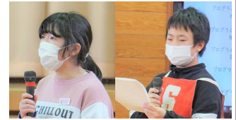
5年生が中心となって準備や進行を頑張りました。

先週3日(金)、5年生が実行委員となって企画した「6年生ありがとうの会」が行われました。1年生と手をつないで花のアーチをくぐって6年生が入場したあと、各学年からのプレゼントタイムとして、手作りのメダルやマッサージのプレゼント、感謝の思いを込めた川柳やダンスの披露など、どの学年も工夫を凝らした素晴らしい発表でした。その後、すこやかグループに分かれて、ゲーム「王様じゃんけん」や「風船バレー」で楽しみました。