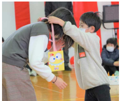
1年生からメダルのプレゼントがありました。

ゲームのあとは、1年生のときの顔写真と現在の顔写真を並べ、クイズを交えながら6年生一人一人を紹介したり、1年生のときからの思い出の写真を見ながら6年間を振り返ったりしました。6年生からは、在校生へのお礼として、長縄による「8の字跳び」の挑戦があり、目標の150回を更新する頑張りを披露して、在校生のエールに答えていました。最後は、6年生の前途を祝して、くす玉を割ってお祝いしました。