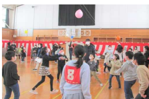
すこやかグループごとに「風船バレー」を楽しみました。

内小のリーダーとして全校を引っ張ってくれた6年生に対する後輩たちの感謝の気持ちが伝わる温かい会になり、6年生は終始笑顔でした。この会の成功のために、5年生が中心となり、在校生みんな準備してきました。6年生からのバトンを引き継ぎ、来年度も内小をさらに素晴らしい学校にしてくれる、そんな期待が大いに高まりました。