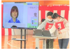
1年生の頑張りを振り返り成長を実感しました。

内小のリーダーとして全校を引っ張ってくれた6年生に対する後輩たちの感謝の気持ちが伝わる温かい会になり、6年生は終始笑顔でした。この会の成功のために、5年生が中心となり、在校生みんな準備してきました。6年生からのバトンを引き継ぎ、来年度も内小をさらに素晴らしい学校にしてくれる、そんな期待が大いに高まりました。