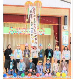
6年生と担任の〇〇先生