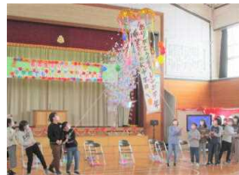
6年生の前途を祝して、くす玉を割りました。