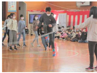
6年生が「8の字跳び」で150回に挑戦し、見事達成！