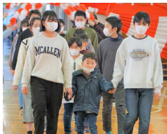
6年生が1年生と手をつないで入場しました。

先週3日(金)、5年生が実行委員となって企画した「6年生ありがとうの会」が行われました。1年生と手をつないで花のアーチをくぐって6年生が入場したあと、各学年からのプレゼントタイムとして、手作りのメダルやマッサージのプレゼント、感謝の思いを込めた川柳やダンスの披露など、どの学年も工夫を凝らした素晴らしい発表でした。その後、すこやかグループに分かれて、ゲーム「王様じゃんけん」や「風船バレー」で楽しみました。