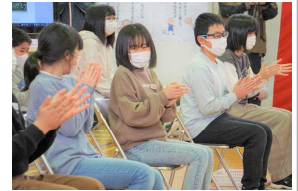
6年生は終始笑顔でした。

ゲームのあとは、1年生のときの顔写真と現在の顔写真を並べ、クイズを交えながら6年生一人一人を紹介したり、1年生のときからの思い出の写真を見ながら6年間を振り返ったりしました。6年生からは、在校生へのお礼として、長縄による「8の字跳び」の挑戦があり、目標の150回を更新する頑張りを披露して、在校生のエールに答えていました。最後は、6年生の前途を祝して、くす玉を割ってお祝いしました。