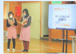
ぼけっとさんによる読み聞かせ