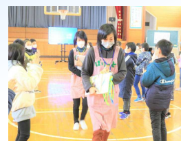
みんなで拍手でお見送りしました