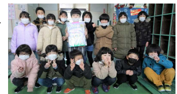
支援学校のお友達と一緒に記念撮影

昨日15日(木)に、大曲支援学校の2年生と職員の方が来校し、毎年恒例の手作りカレンダーを贈呈してくださいました。本校の2年生全員が児童玄関でお迎えし、代表として〇〇〇〇さんが受け取り、「カレンダーありがとうございます。」とお礼を述べました。全校児童が見ることができる場所に掲示して、大切に使用させていただきたいと思ひます。