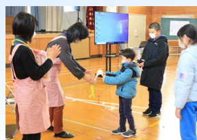
ぼけっとさんへのプレゼント贈呈