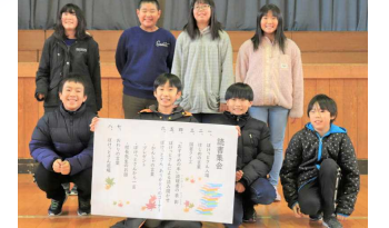
ワクワクブック委員会のメンバー