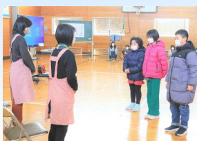
ぼけっとさんへの感謝の言葉