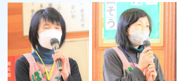
ぼけっとさんから一言いただきました