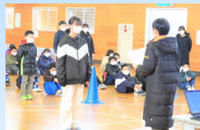
「おすすめの10冊」読破者表彰