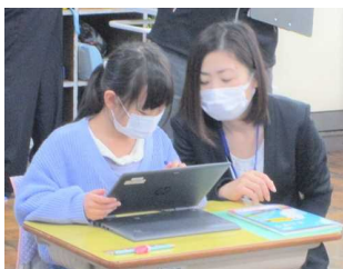
1つ分の数を○で囲んで、かけ算をすると…。

〇〇指導主事からは、「教室内の掲示物から、これまでの積み重ねを強く感じた。また、図や式、『1つ分の数』等、子どもたちに考えるための視点をもたせる教師の手立てがしっかりしており、子ども同士の関わり方も大変素晴らしい。」との感想をいただいた他、参観した先生方からもたくさんのお褒めの言葉をいただきました。