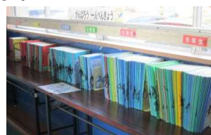
1階チャレンジルーム前廊下に全校児童の家庭学習ノートが展示されています。

春から毎日子どもたちが頑張っている家庭学習。その家庭学習で使ったノートが、現在全校で371冊になりました。このペースでいくと、今年度末には600冊に届きそうです。どこまでいくか、今から楽しみです。