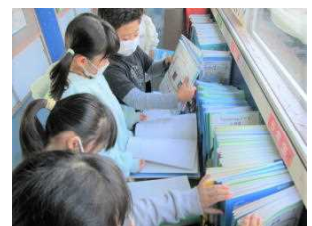
友達や先輩の家庭学習ノートはどんな感じかな？