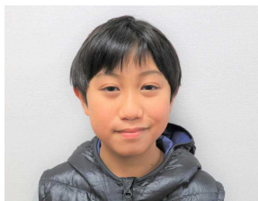
よろしくお願いします！

朝のリモート集会で全校児童に紹介されました。一日も早く内小友小学校に慣れて、みんなと楽しい学校生活を送ってほしいと思います。