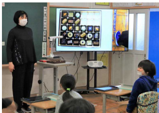
箱の中のチョコレートは全部で何個あるのかな？

今週火曜日、大仙市教育委員会の〇〇〇〇〇指導主事をお招きし、2年生の算数科の授業を見ていただきました。箱の中にあるチョコレートのお菓子の数の求め方を、かけ算と結び付けて考え、解決する学習が展開されました。