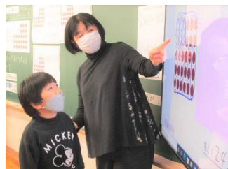
友達はどんな求め方をしたのかな？