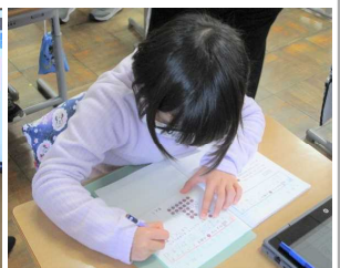
今日の学習を生かして評価問題に挑戦！