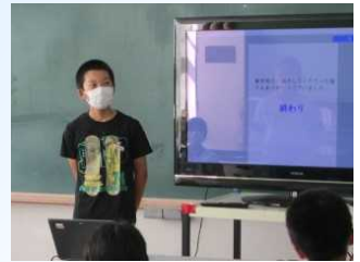
6年生による修学旅行の報告

学年を超えて子どもたちが交流することは、上学年にとっても下学年にとっても、大きな教育的効果があると考えます。今後も縦割り班による活動を大切にしていきたいと思っております。