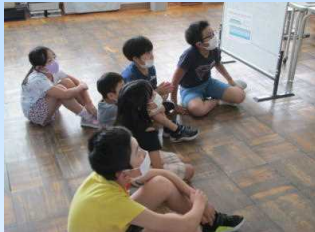
食い入るように見る後輩たち

先週木曜日に「すこやか遊び」を全校児童で行いました。本校には、「すこやかグループ」という10グループの縦割り班がありますが、班長さんを中心に、班員みんなが楽しめる遊びを考えてくれました。