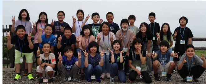
大川西根小の5年生と一緒に記念撮影