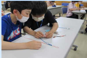
貝殻ストラップ作り

また、多くの場面で大川西根小学校の皆さんと協力して活動する姿が見られ、お互いの親睦を一層深めることができました。