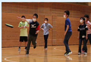
みんなでドッジビー