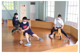
木のおもちゃ美術館で