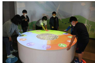
フェライトこども科学館で