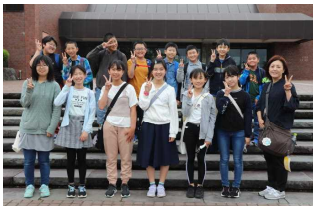
県立博物館で集合写真！

引率した先生方からは、どの見学地でも、子どもたちはルールやマナーを守って行動し、施設の方々からたくさんのお褒めの言葉をいただいたと聞きました。あいさつや受け答えも大変立派にできたとのこと。改めて、最高学年としての6年生の成長を実感しました。子どもたちからは、「秋田のよさを再確認できた。また、友だちと2日間過ごして、友だちのいいところを新たに発見できた。楽しい修学旅行になった。」という声が聞かれました。6年生にとって、一生の思い出に残る2日間になったと思います。