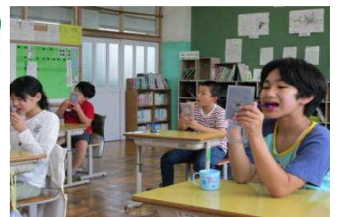
4年生の歯磨き指導の様子

現在、養護教諭による歯磨き指導を各学級で行っています。小学生の時期は、歯が乳歯から永久歯に生え変わる時期であり、正しい歯磨きの仕方や習慣を身に付けさせる大変重要な時期です。歯ブラシの正しい持ち方や動かし方等、きれいに磨くコツを学び、その後に歯垢の染め出しをしています。歯の健康について、ご家庭でも話題にいただければと思っています。