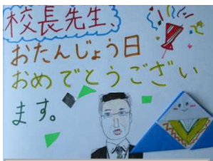
3年 〇〇 〇さん 作

先日、私(校長)の誕生日(5/28)のお祝いということで、全校児童からのお祝いメッセージを収めたアルバムをプレゼントを児童を代表して、6年の〇〇〇〇〇さんと〇〇〇〇さんが届けてくれました。突然のサプライズに涙が出るほど感激しました。