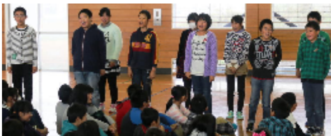
あいさつの手本を見せている6年生

11月8日に行われた標記大会に大曲西支部代表として、〇〇〇〇(6年)さん、〇〇〇〇〇(5年)さん、〇〇〇〇〇(3年)さんが大会に参加して3位入賞を果たしました。おめでとうございます。