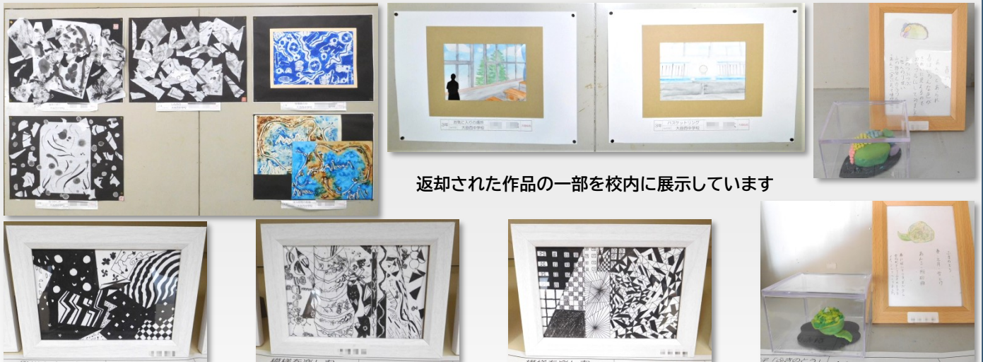
返却された作品の一部を校内に展示しています

※学校便り第33号で紹介した自由部門の全ての出品者には、参加賞として「讚美」の賞状が贈られます。