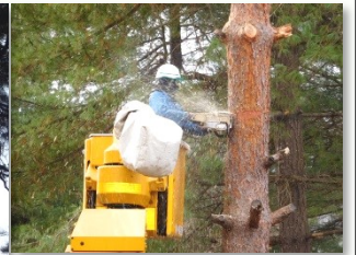
高所作業車を使つての伐採作業