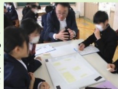
講師の先生がグループ協議にアドバイス

「曲屋見学」にも来てくださった「やまと建設事務所」の社長さんでしたが、社長さんは建築士として、家のデザインだけでなく、建物やまちの「エコ」のことを考えて仕事をしているそうです。生徒たちにも「自分の家の中や周りでエコではないと思うところ」を考えることを通して、持続可能な社会構築の視点から、これからの住生活について考えを広げたり深めたりする学習を進めてくださいました。