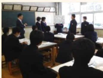
グループで考えたエコハウスを発表

グループ学習の場面では、学校ごとのグループで意見交換が行われましたが、生徒たちはそれぞれが自分の生活を振り返ったり、これまで学んできたことを生かしたりしながら、様々な考えを出し合っていました。とても柔軟な発想の生徒が多く、社長さんもそういったオリジナリティあふれるアイデアを大いに褒めてくださっていました。まとめの場面では、南中と本校2グループずつが発表しましたが、いずれもユニークなものでした。