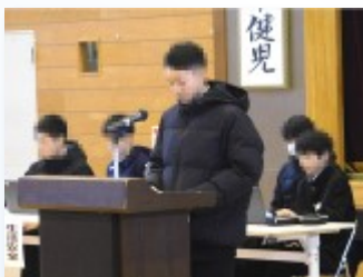
新専門委員長が後期活動計画を説明

もちろん、総会当日もタブレットと椅子のみを持参して集合です。総会は新生徒会長のあいさつに始まり、総務部や各専門委員会の前期活動報告と後期活動計画案の説明・承認という内容で進められました。総会の進行は生徒会副会長が、議長や書記は学級正副委員長が務めてくれましたが、大変立派な進行ぶりでした。質問や要望については事前に募っていましたが、総会の場ではあまり出ませんでした。議案書をよく読み込んでいることが分かるものが多く、総務部や各専門委員長の回答や説明も大変丁寧で、学校をよりよくしていきたいという気持ちや誠実さが伝わるものでした。