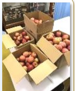
いただいたリンゴの「一部」です

昨年度までは、本校の生徒が農業科学館のリンゴ畑にお邪魔して収穫体験をさせていただいておりましたが、今年はクマの出没が相次ぎ、農業科学館のリンゴにも被害の跡が見られたことから、現地での収穫体験はかないませんでした。その代わりに、科学館の職員の方が収穫したリンゴを西中生にも食べてほしいと届けてくださったものです。いただいたリンゴは、その日のうちに生徒に持ち帰らせたので、既にお召し上がりになったご家庭もあるかと思います。