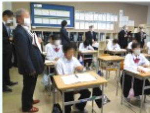
お客様に囲まれて緊張気味の1年生

その後、授業参観をしていただき、訪問された皆様からは以下のようなご感想をいただきました。