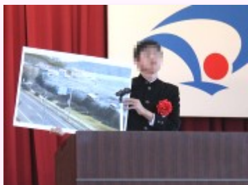
津波の恐ろしさを写真を手に熱弁

防火防災意識を高めるとともに、地域住民の防火防災活動と防火防災意識の普及向上を図る目的で毎年実施されているもので、今回は6校から各校1名の生徒が出場しました。