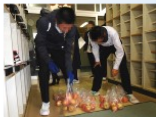
4個ずつ持ち帰りました

農業科学館の皆さんには何かとお世話になっておりますが、今回のプレゼントにも心から感謝申し上げます。