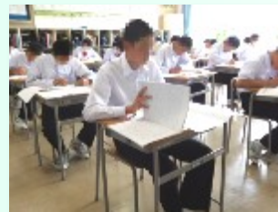
社会科は、自分でまとめたノートを見ながら解答

テストの間は、各学年とも集中してテストに臨む姿が見られましたが、最後となる5時間目のテスト終了時には、校内のどこからともなく「終わったー!」という声が聞こえてきました。それだけみんな集中してテストに向き合った1日だったのだらうと思います。