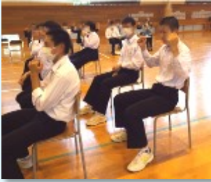
気持ちを広げるための「ハイパワーポーズ」