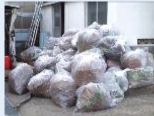
一時間足らずで、これだけの草や枝が集まりました