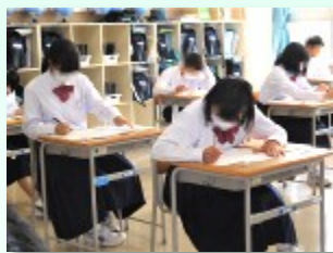
初めての定期テストに臨む1年生

今回の定期テストは、国語、数学、英語、理科、社会の5教科で行われました。新年度が始まってまだ2ヶ月という時期に行われることもあり、比較的限られた範囲の出題であり、教科によっては、前の学年の内容も含まれていました。テストの2週間前に範囲が発表され、各自が作成したテスト当日までの計画