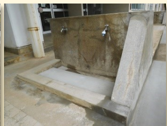
老朽化により、ひび割れが目立っていた玄関前の階段や洗い場もきれいになりました

5月はこのほかにも、ロータリーの舗装の破損箇所や、玄関前のコンクリートの補修も行っておりますが、子どもたちにとって安全で安心な学校生活のために、今後も気を配っていきたくと思っています。