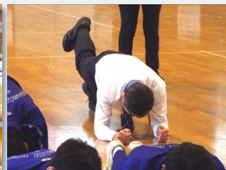
肘とつま先で身体を支えるトレーニングに先生も挑戦!