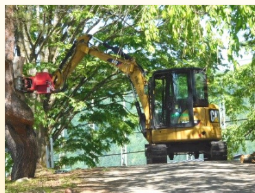
太い木は重機を使って処理

この日は、業者さんが長いのこぎりや重機などを用い、半日かけて作業を行っていただきました。特に松食い虫の被害に遭った木は、6月頃までに処置をしないと、松を枯らす原因となる線虫を運ぶ役目を果たす昆虫が枯れた松の木の中で羽化し、他の健康な松の木に移ることで他の木にも被害が広がる可能性が高くなるということで、早い時期に処置していただきありがたく思っています。