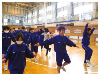
目を閉じての片足立ちは、意外に難しいようです

「体幹」とは、身体の胴体部分を指しますが、この胴体部分を強化するトレーニングであり、身体の深層部にある筋肉(インナーマッスル)を鍛えるトレーニングでもあるそうです。