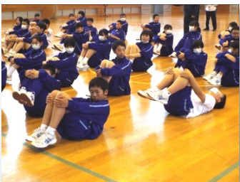
足を少しだけ浮かせる体育座りにも苦労している生徒がチラホラ...

この日は、先生が示す見本を真似しながら、様々なトレーニングを全校一斉に行いました。どれも見た目は簡単