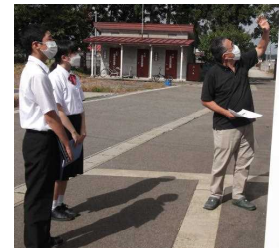
職場訪問（1年） 小松煙火工業

「キャリア教育」とは、「生徒一人一人の社会的・職業的自立に向けて、社会の中で自分の役割を果たしながら、自分らしい生き方を実現していくことを促す教育」を意味します。人は人生の多くの時間を働か