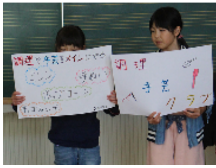
「調理・手芸クラブ」