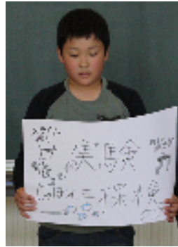
「実験・探検クラブ」