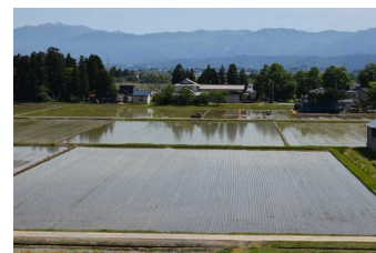
本校4階から東を望む

先週から、本校の周りの田んぼでは、田植えが始まりました。好天に恵まれて、作業の進み具合は順調のようです。皆さんの家でも田植えの真っ最中というところが多いのではないのでしょうか。生徒の皆さんは、部活動等で忙しいと思いますが、できるときにはしっかりお手伝いしてくださいね。