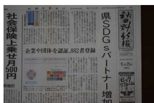
秋田魁新報の記事

5月25日付けの秋田魁新報一面に、このような記事が掲載されました。県SDGsパートナーに登録された事業所等が882者になり、今後も増加するだろうという記事です。本校は令和3年11月19日に第一期パートナーとして登録されています。それから1年半の間に、登録者が約3倍になりました(ただし、中学校は2校のみです)。それだけ世の中はSDGs達成のために、本気になっているということだと思います。本校の生徒の皆さんは、SDGs達成のために様々な勉強や体験をしています。これからも外部と連携した授業等を計画していますので、ご期待ください。