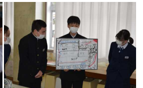
エコハウスを設計しよう