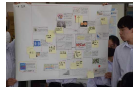
気候変動ミステリー授業