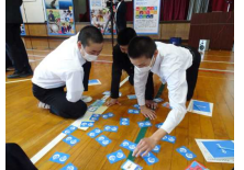
生物多様性ゲーム