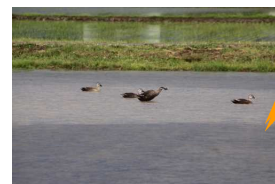
《スケッチ》 田んぼに 飛来した カモたち