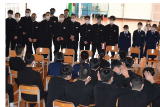
在校生から歌のプレゼント