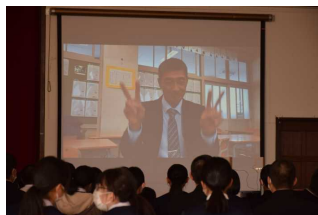
保護者からのメッセージ