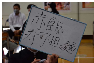
給食ベスト3なんだけど...

生徒会総務が主催した、3年生への感謝の会が8日(水)に行われました。全校縦割りの班に分かれ、クイズとジェスチャーゲームで楽しみながら得点を競いました。3年生は生徒会総務の素晴らしい企画にノリノリで、終始笑顔で参加しました。終盤には、保護者の皆さんからの動画メッセージと3年間のまとめたスライドショーが流れ、卒業を実感したのではないのでしょうか。そして、最後に在校生から歌のプレゼントがあり、本来はそこで終了する予定でしたが、3年生から「ちょっと待った!」という声が上がリ、3年生一人一人からメッセージがありました。この時点ですでに涙の3年生も見受けられました。