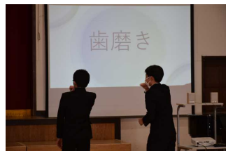
ゼスチャーゲーム