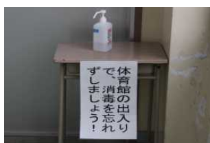
体育の前後も手指消毒