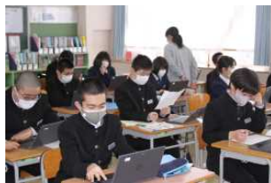
授業中は常にマスク着用

このような対策をしていますが、100%感染を防ぐことはできません。いつどこで感染するか分からないのがオミクロン株です。したがって、「誰が感染した」とか「どこで感染した」などの詮索をしたり、感染者やその家族等をいじめたり、誹謗中傷したりすることは決してあってはなりません。学校評価で「素直で優しく、お互いを尊重し合っている」と高い評価を受けた南中生ですので、このようなことはないと思っています。