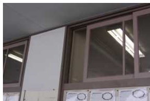
廊下の窓を開け常時換気