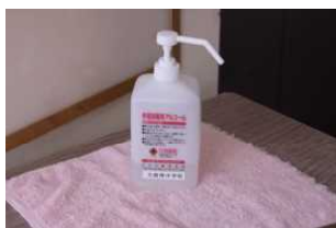
玄関での手指消毒