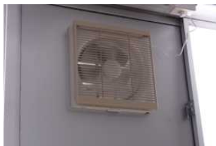
換気扇での常時換気