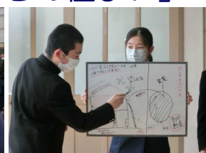
エコハウスの説明