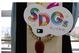
このカメラに向かって話します