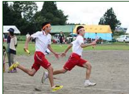
＜藤木 色別リレーで激走する3年＞

両地区に分かれた本校生徒も、選手や競技役員としてそれぞれの地域にちよっぴり貢献できた秋の1日でした。