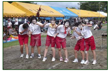
＜角間川 3年女子化粧レース＞

台風と秋雨前線の影響でグラウンド状態も悪く、例年通りの開催が危ぶまれた地区民運動会でしたが、奇跡的な天気回復と関係者の努力で無事に開催することができました。