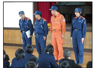
大曲消防署の皆様

本格的な冬を前に、今年度 3 回目の避難訓練を行いました。今回は、 降雪期に火災が起きた という想定です。大曲消防署員立会いの下、通報訓練・初期消火対応・防火扉点検も行いました。避難訓練後は体育館に集合し、消防署の方から指導講評をいただきました。