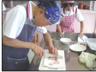
食育講座でゴーヤ料理に挑戦する2年生 →