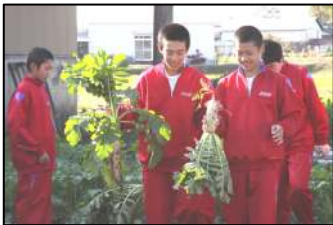
← 畑でダイコンを収穫して喜びに浸る1年生