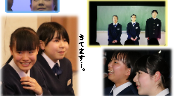
企画③「教頭先生の号泣のお話」