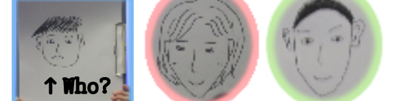
企画②「スライドショー&メッセージ」