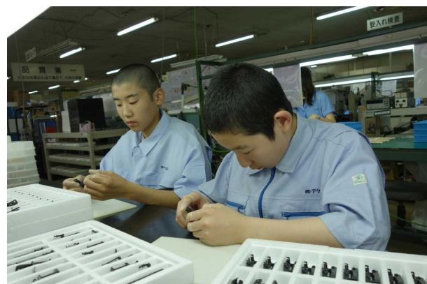
職業体験 体験を通して働く意義を学ぶ（2年生:7月）