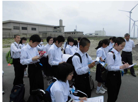
ユース秋田港ウインドファーム見学 再生可能エネルギーの学習（2年生:5月）