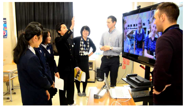
スカイプでの交流学习 オーストラリアの中学生と交流（3年生:10月）