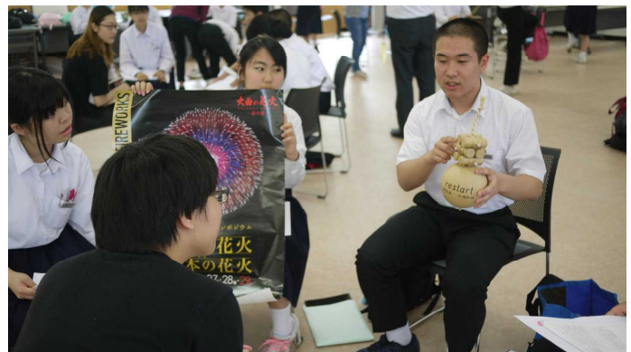
国際教養大学訪問と留学生との交流 南地区の紹介や環境対策意見交流（3年生:6月）