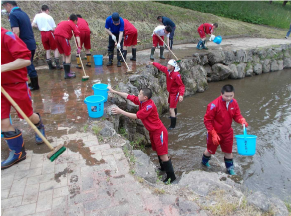
公園清掃ボランティア 2つの小学校と分担して公園清掃（5月）