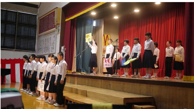
学校祭での学びの発信 エネルギーバランスについて（2年生:10月）