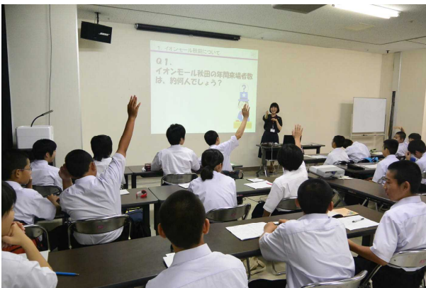
イオンモール秋田での環境対策調査 積極的に質問し深い学習へ（1年生:7月）