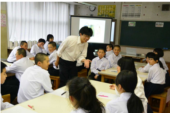
微生物の役割についての学習 大曲農業高校博士号教員より（1年生:6月）