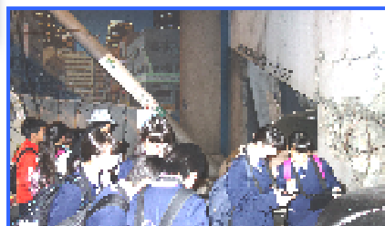
地震の街でどう生き延びるか体験!