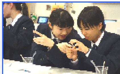
TEPIA で自分の DNA を採取中