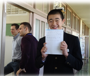
原稿を手にドキドキの3年生