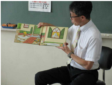
吉沢教諭 「バムとケロのにちようび」