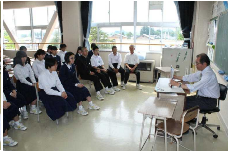
教頭 「世界で一番つよい国」