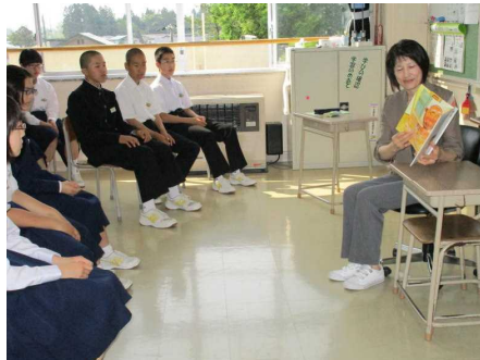
荒川教諭 「おじいちゃんのごらくごらく」