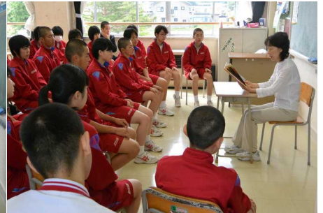
今川教諭 「おじいちゃんのごらくごらく」