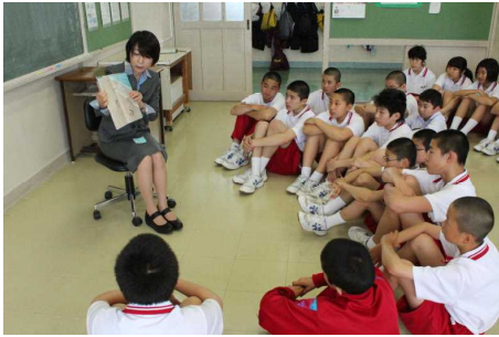
校長 「はなみずきのみち」